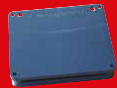
AF® Metal Detectable Insect Monitor