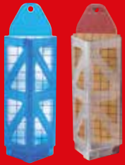
AF® Demi Diamond