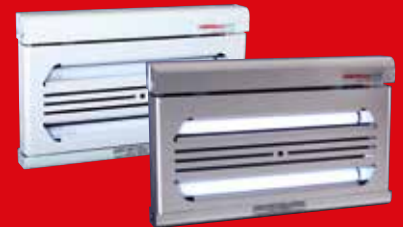
Chameleon® 1x2 Discretion