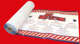
AF® No Zone