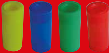
Spectrum Feromoon Management System