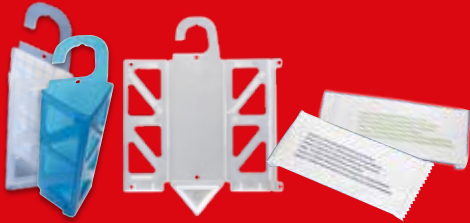
AF® Demi Diamond