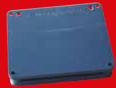
AF® Metal Detectable Insect Monitor