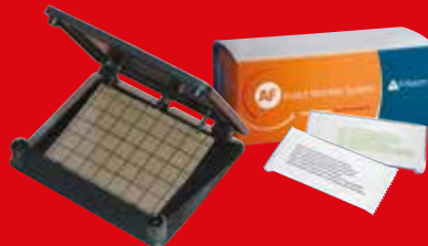
AF® Insect Monitor